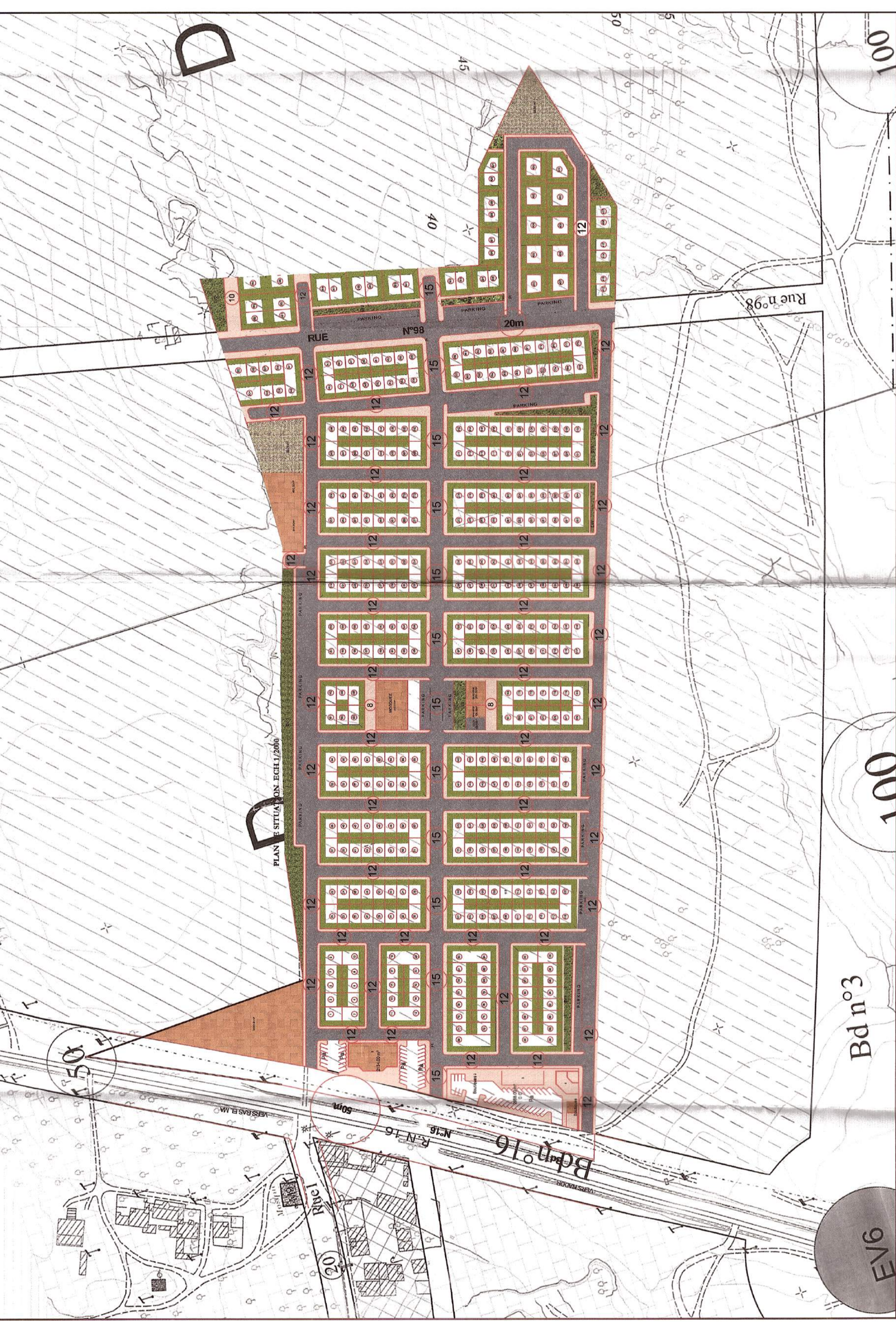
PLAN DE SITUATION ECH 1/2000